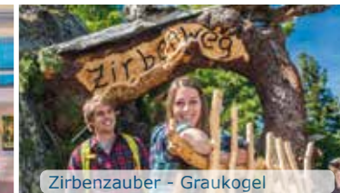
Zirbenzauber - Graukogel