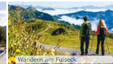
Wandern am Fulneck