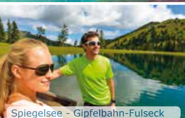
Spiegelsee - Gipfelbahn-Fulneck