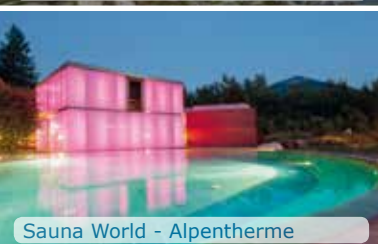
Sauna World - Alpentherme