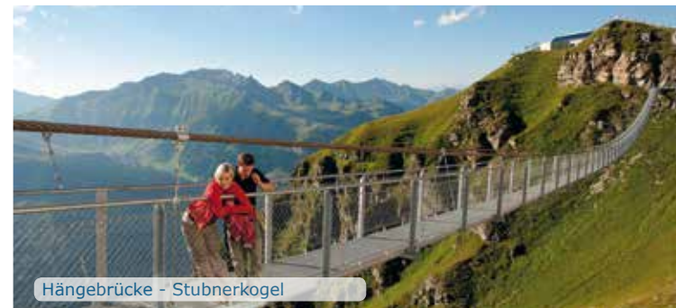
Hängebrücke - Stubnerkogel

All cards are personal tickets and therefore not transferable! Picture required. Free digital photo at the cash desks. Key card required. The deposit of € 3.00 will be refunded when you return the card undamaged. The general terms and conditions can be obtained from the cash desk at each location.