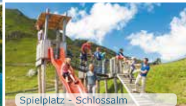
Spielplatz - Schlossalm