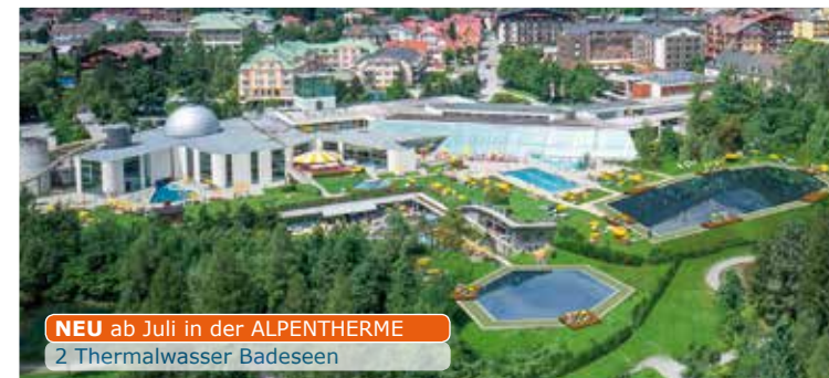
NEU ab Juli in der ALPENTHERME