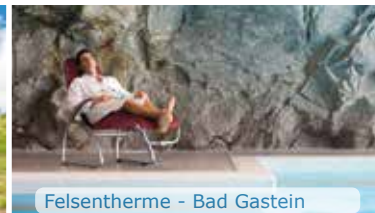
Felsentherme - Bad Gastein